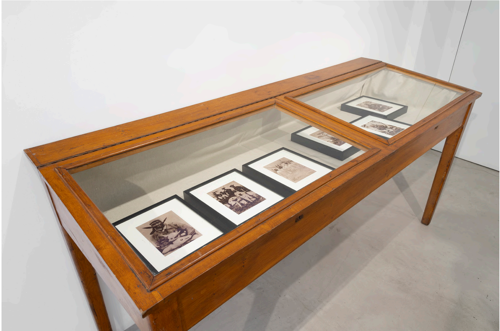
Territorial Machines: Extracting Nature, MAAB Gallery, Milano, 2024