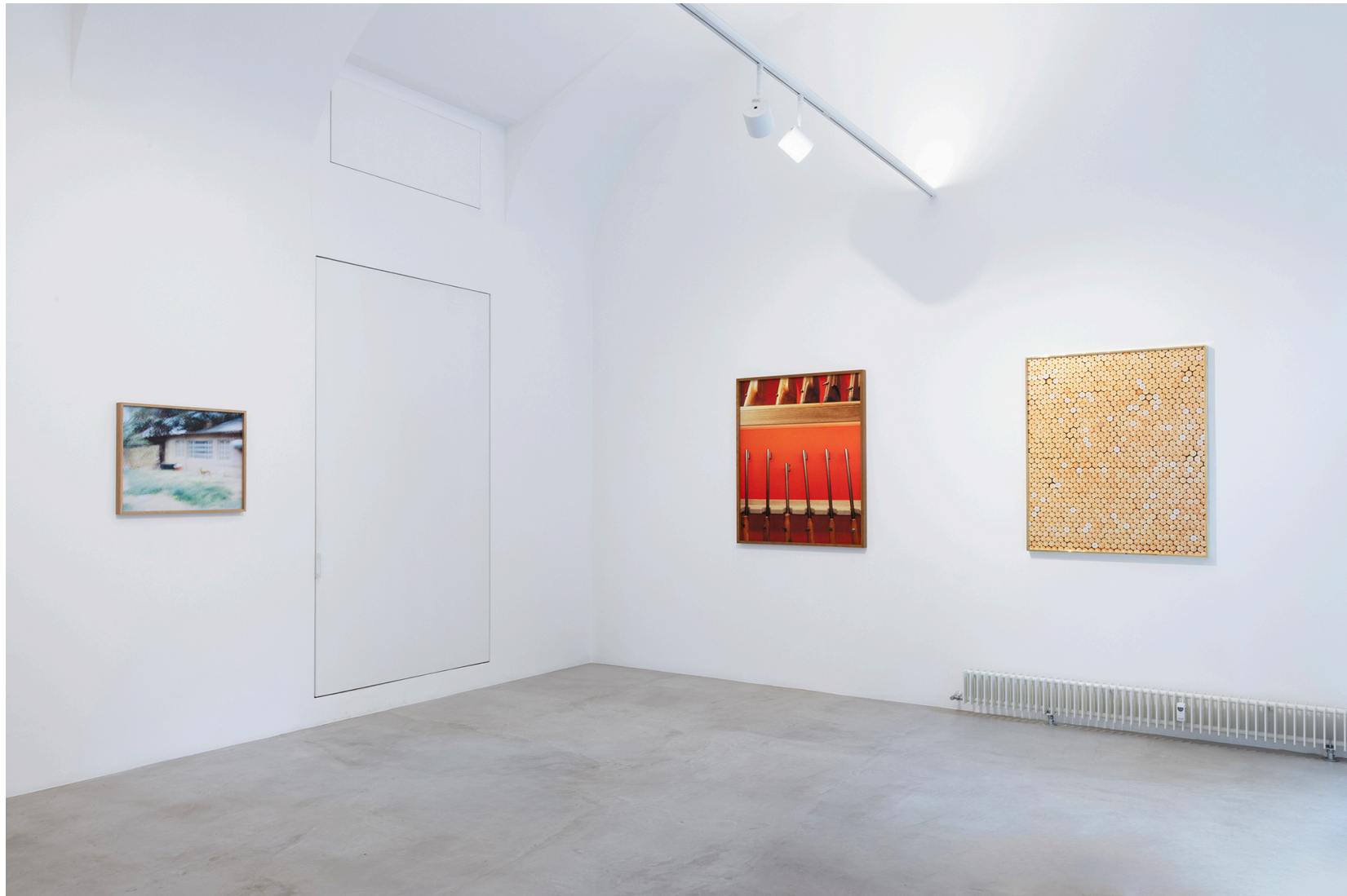
Territorial Machines: Extracting Nature, MAAB Gallery, Milano, 2024