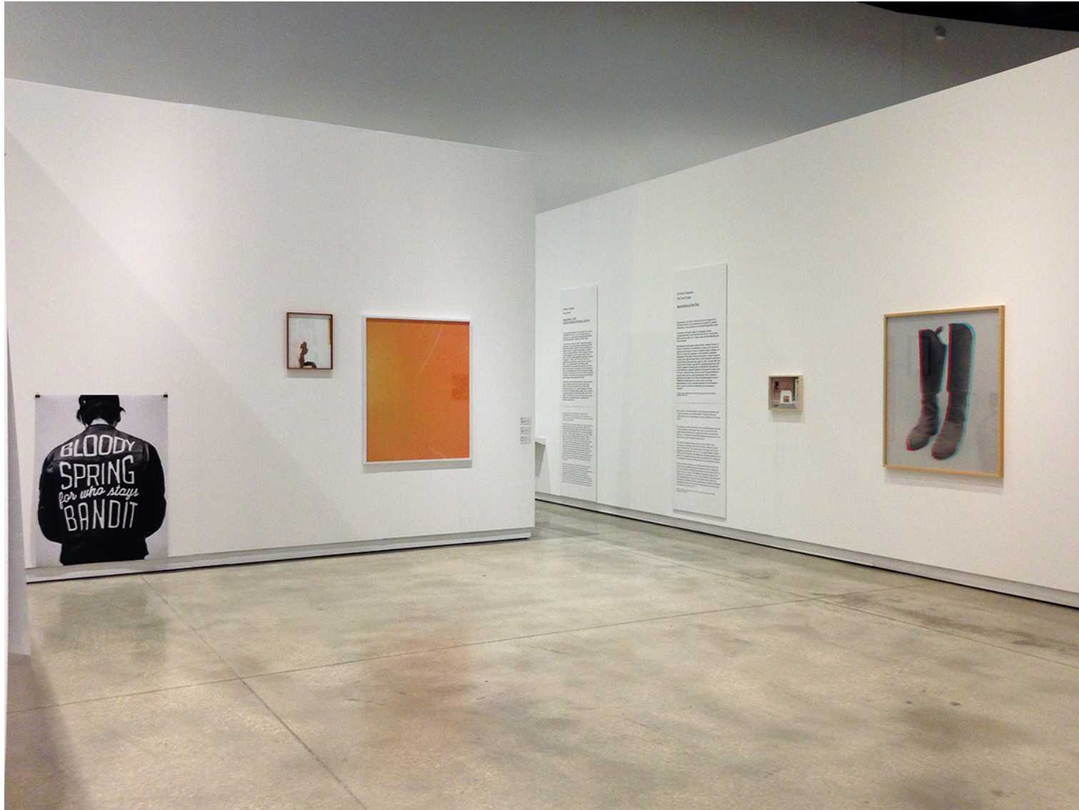
Premio Graziadei, 2016, MACRO - Museum of Contemporary Art of Rome

@MAAB CV ARTWORKS EXHIBITIONS CATALOGUES