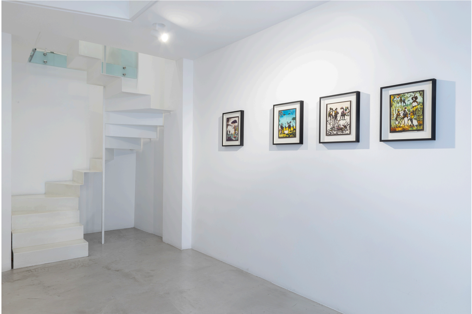
Territorial Machines: Extracting Nature , MAAB Gallery, Milano, 2024