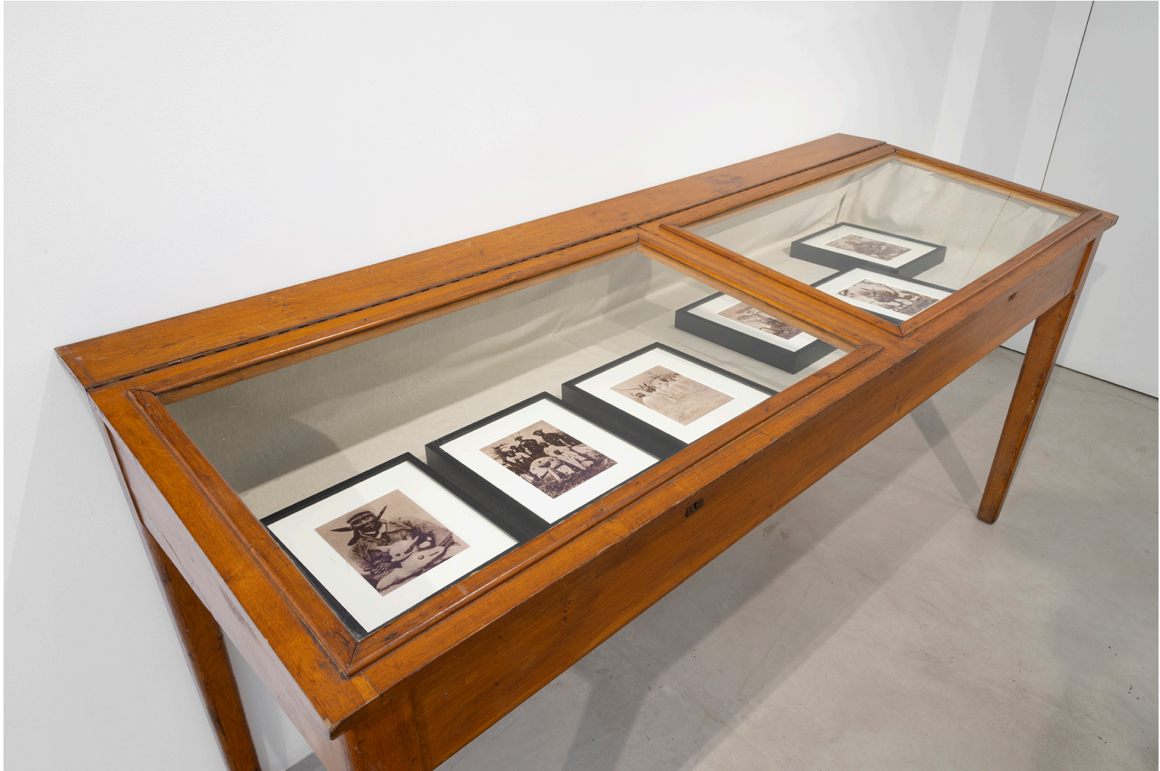
Territorial Machines: Extracting Nature , MAAB Gallery, Milano, 2024