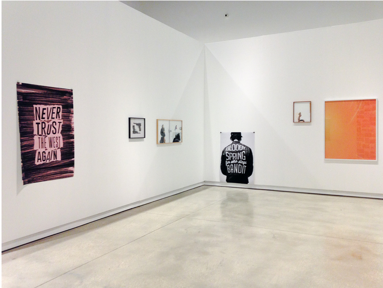
Premio Graziadei, 2016, MACRO - Museum of Contemporary Art of Rome

@MAAB CV ARTWORKS EXHIBITIONS CATALOGUES