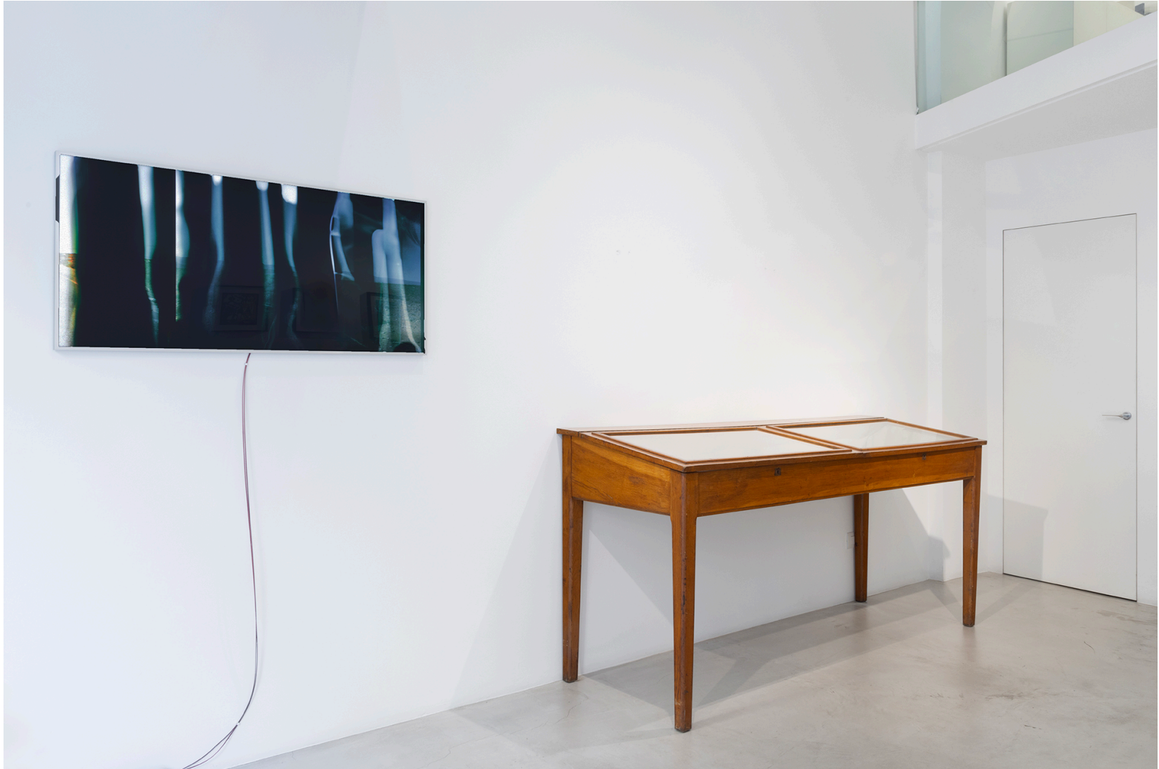
Territorial Machines: Extracting Nature , MAAB Gallery, Milano, 2024