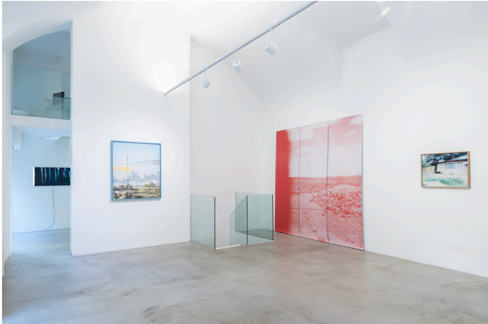
Territorial Machines: Extracting Nature, MAAB Gallery, Milano, 2024