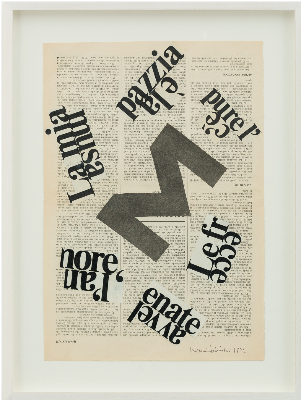
Senza titolo, 1972 collage collage 68 x 38 cm (24,80 x 14,96 in)