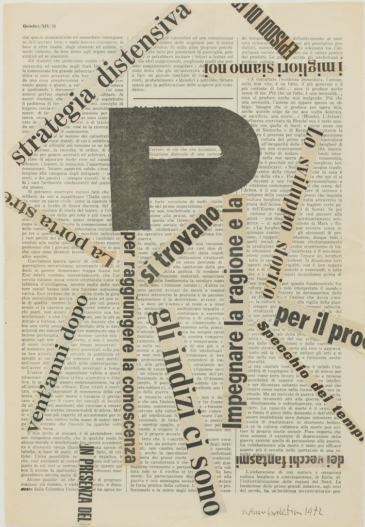
Senza titolo, 1972 collage collage 68 x 38 cm (24,80 x 14,96 in)