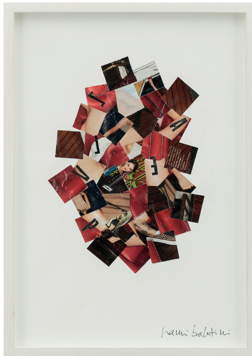
Periscope , 2016 collage collage 42 x 20 cm each (16,53 x 7,87 in each)