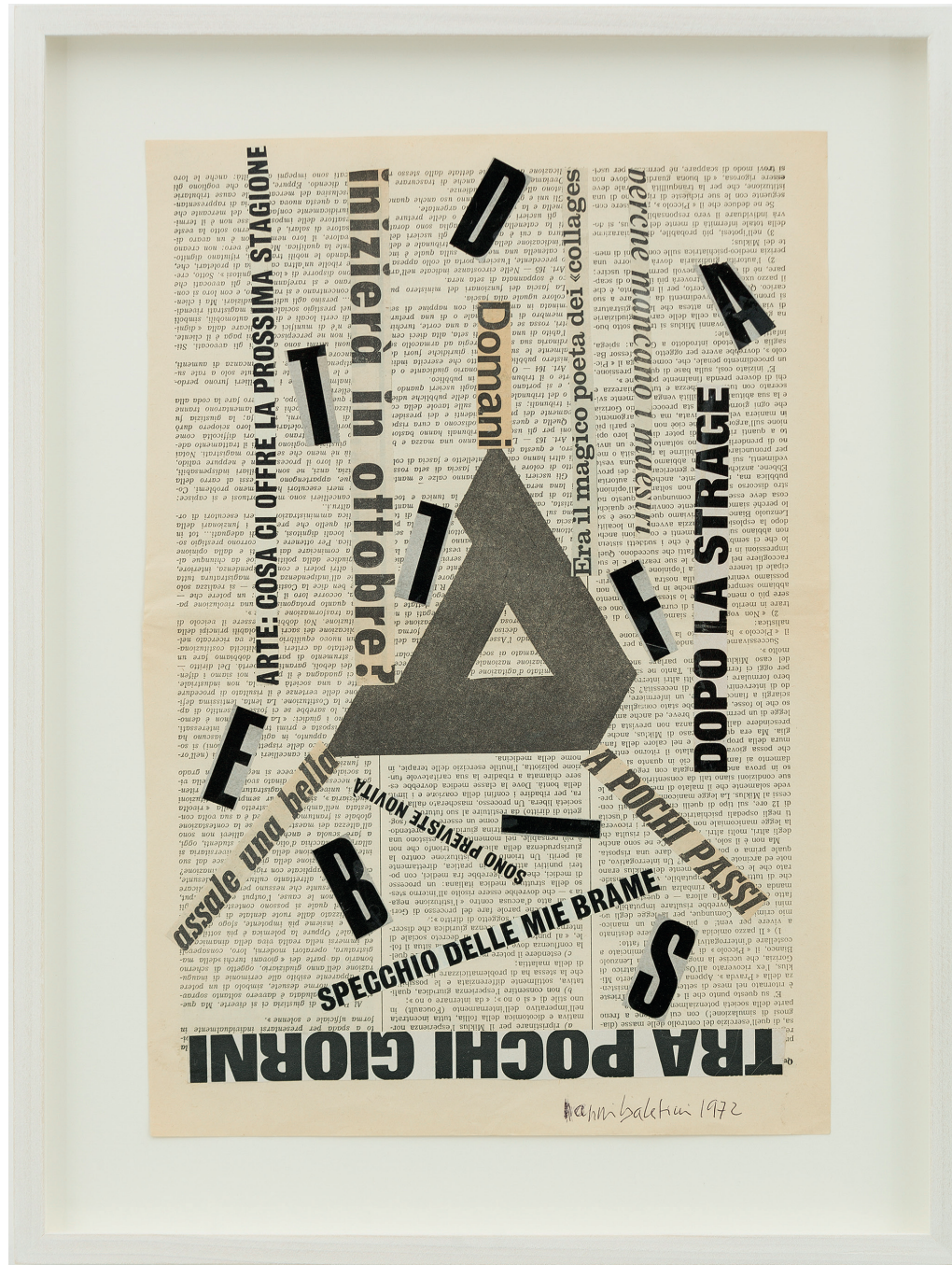
Senza titolo, 1972 collage collage 68 x 38 cm (24,80 x 14,96 in)